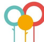
Zorg en aandacht voor de omgeving