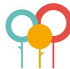
Zorg en aandacht voor de omgeving